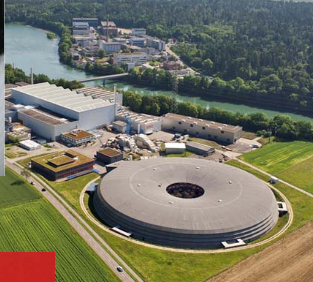
z.B. Paul Scherrer Institut