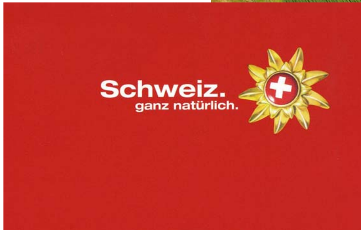
z.B. Schweiz Tourismus